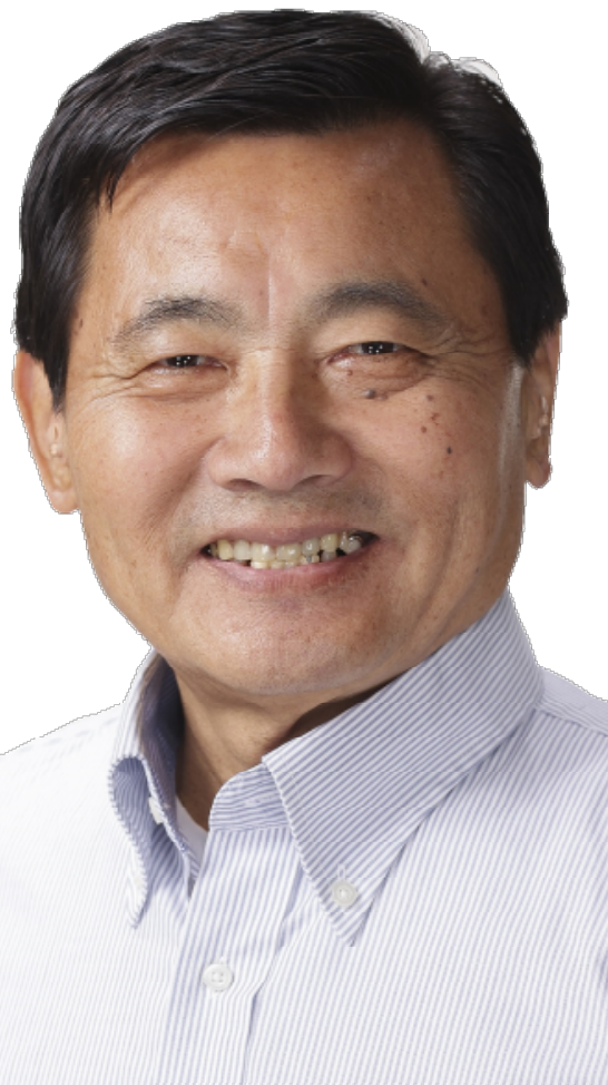
党南部地区副委員長 前長崎市議